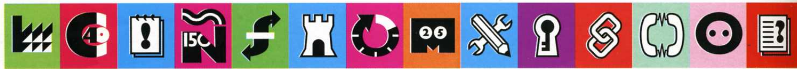
COVERS BROCHURES 'EURONEXT'