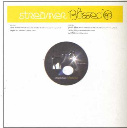
12" COVER 'STREAMER'