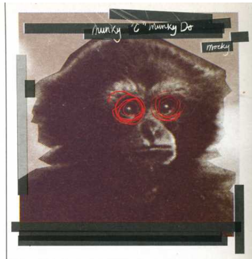
12" COVER 'MOCKY'